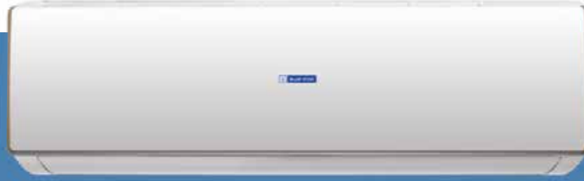
1.5TR / 2.0TR / 2.5TR CXYFA / CXYFB